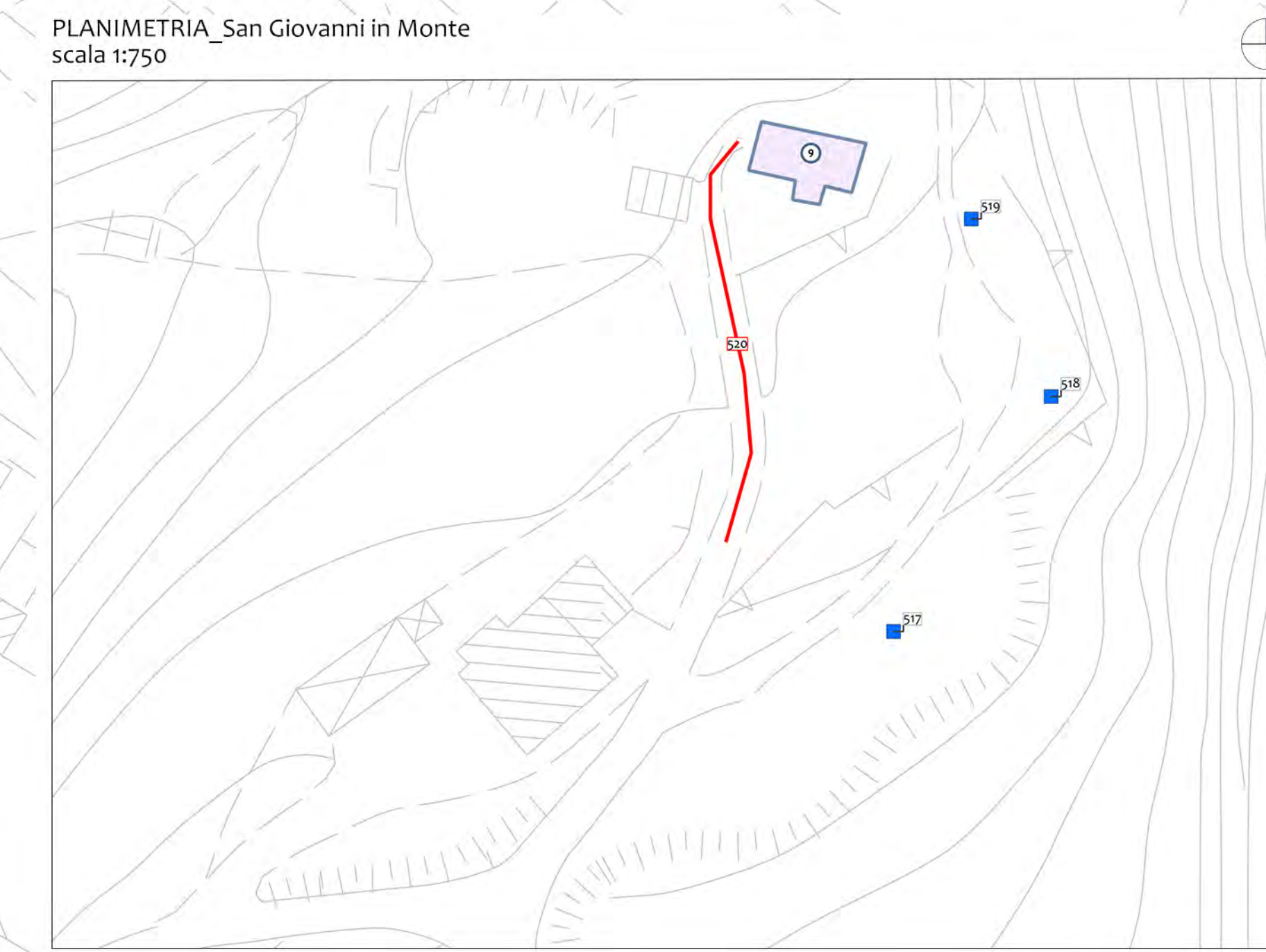
PLANIMETRIA_San Giovanni in Monte scala 1:750