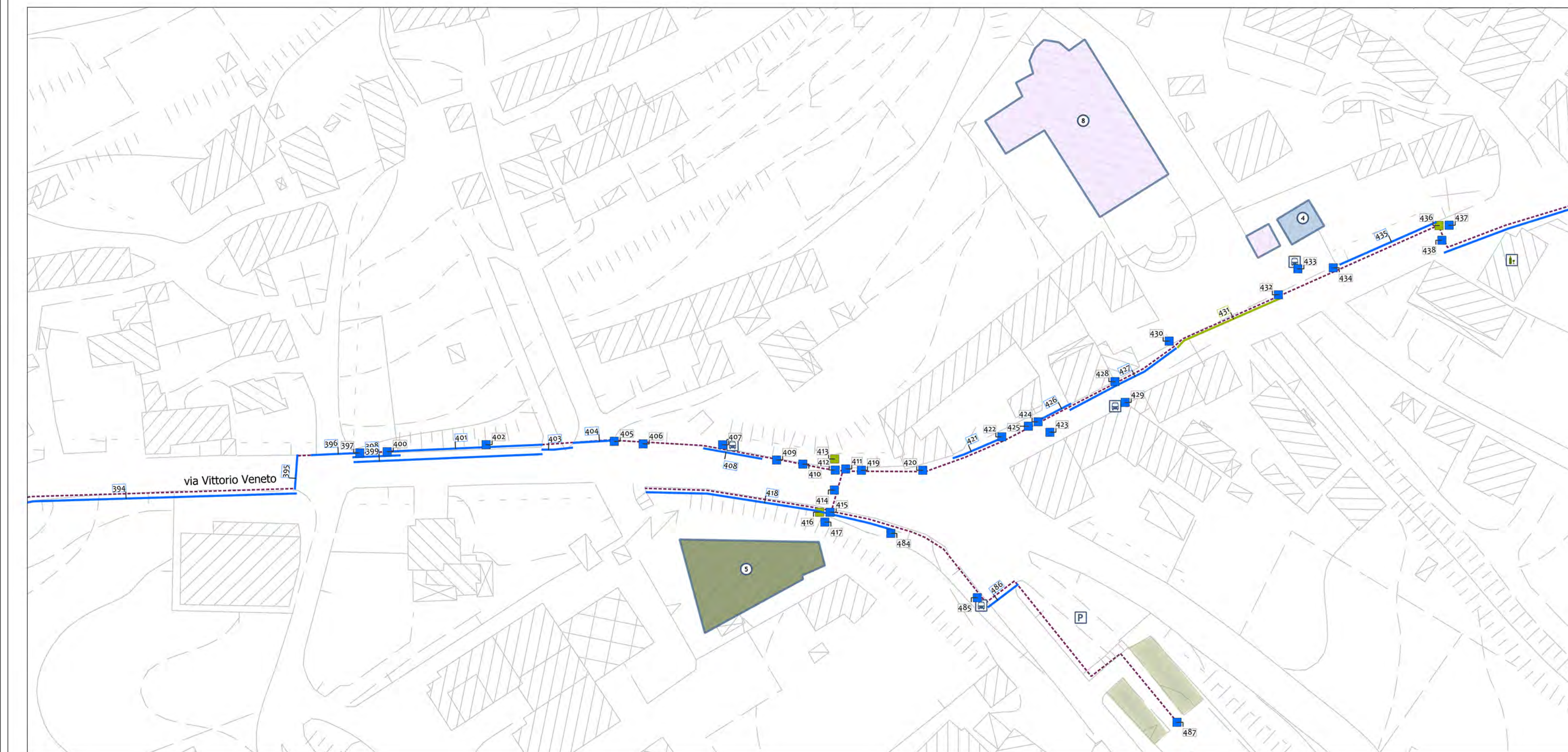
PLANIMETRIA_quadro 6 scala 1:750