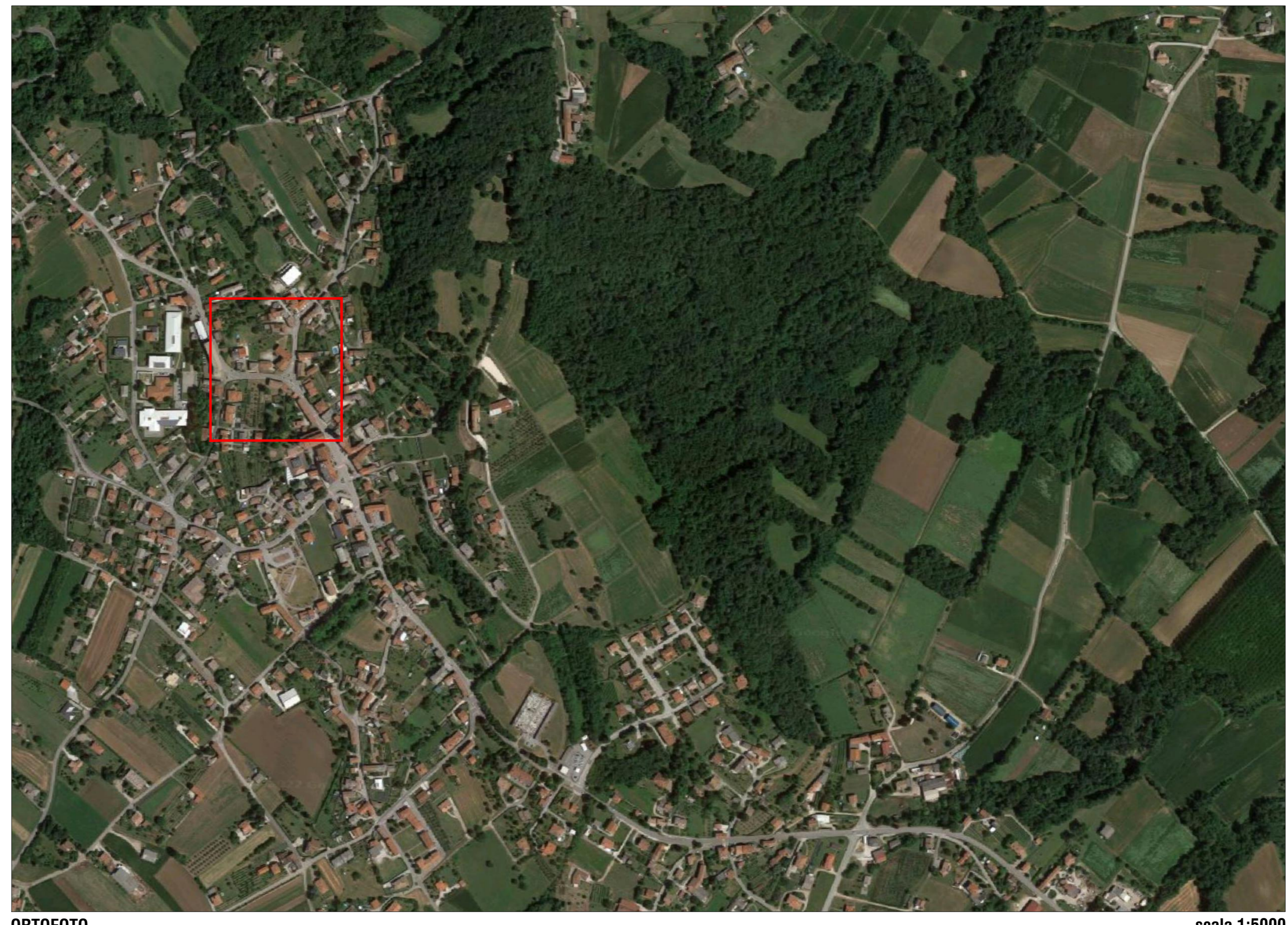
ORTOFOTO scala 1:5000